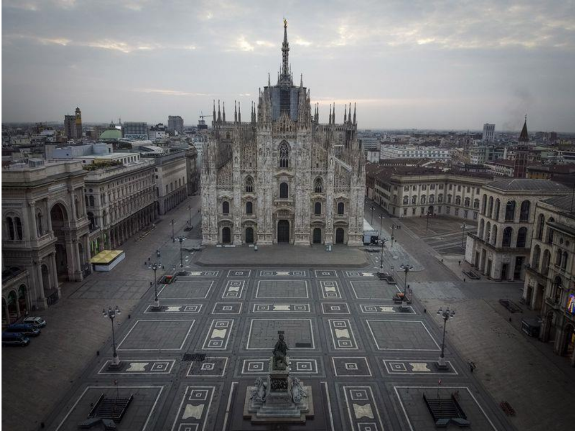
Praça de Duomo a 29 de Março

Pode não ser deslumbrante como Roma ou Veneza, mas é o motor económico do país que impulsionará a recuperação pós-vírus