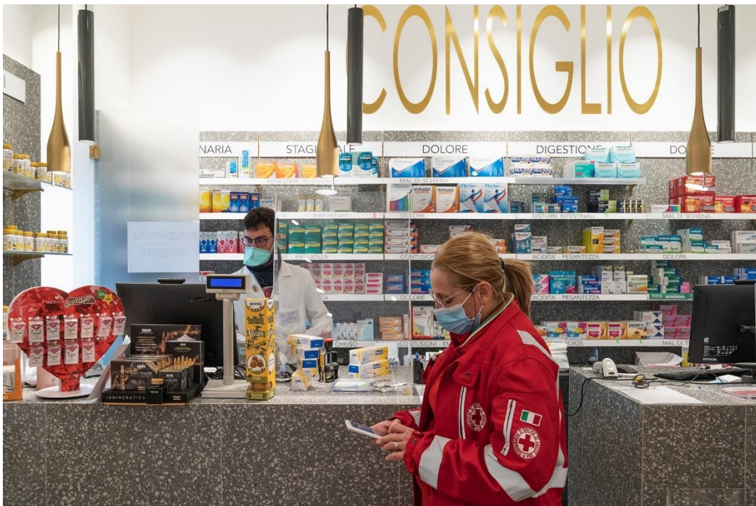
Uma farmácia em Milão.

"Os nossos negócios na China estão a um ritmo normal. É ainda melhor do que imaginámos num cenário pós-crise", diz Battista. "Espero que a Itália e a Europa sigam o mesmo caminho dentro de alguns meses, embora provavelmente a um ritmo mais lento de recuperação."