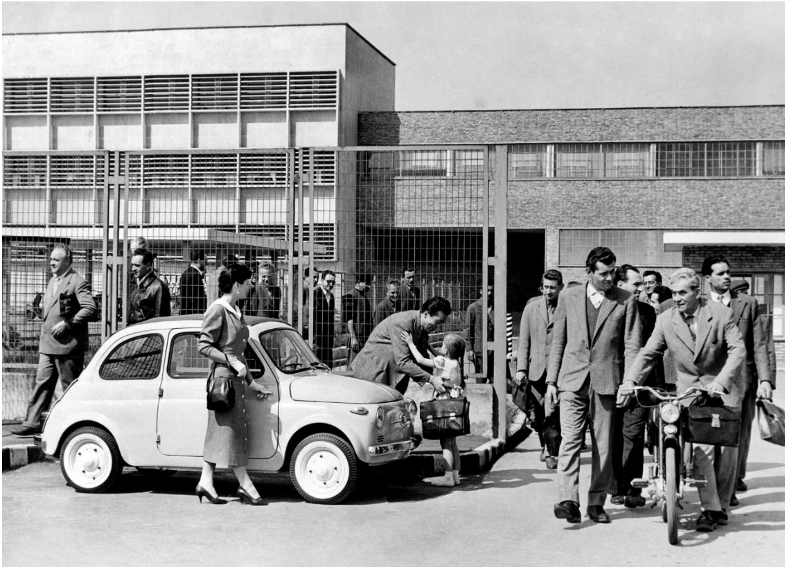
Fiat 500 em 1957.