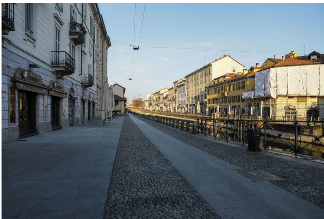
Navigli está tipicamente cheia de restaurantes e mesas ao ar livre.