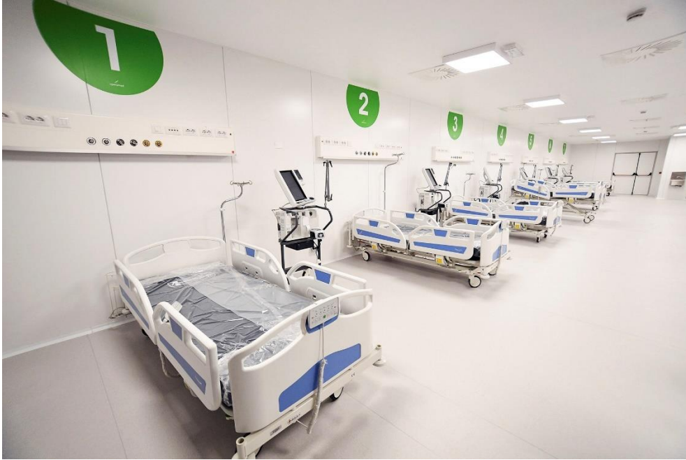
Ala do hospital de campanha na Fiera Milano.