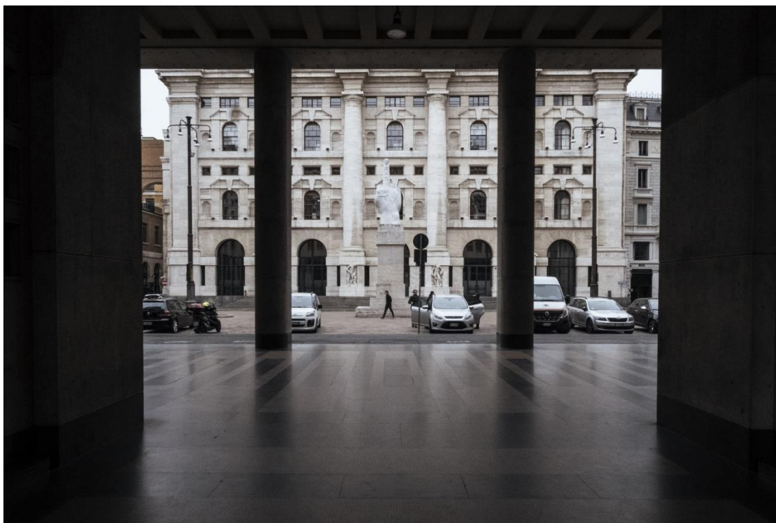
A Borsa Italiana.

"É importante que os bancos estejam predispostos a apoiar a economia", diz Jean Pierre Mustier, CEO da UniCredit SpA.