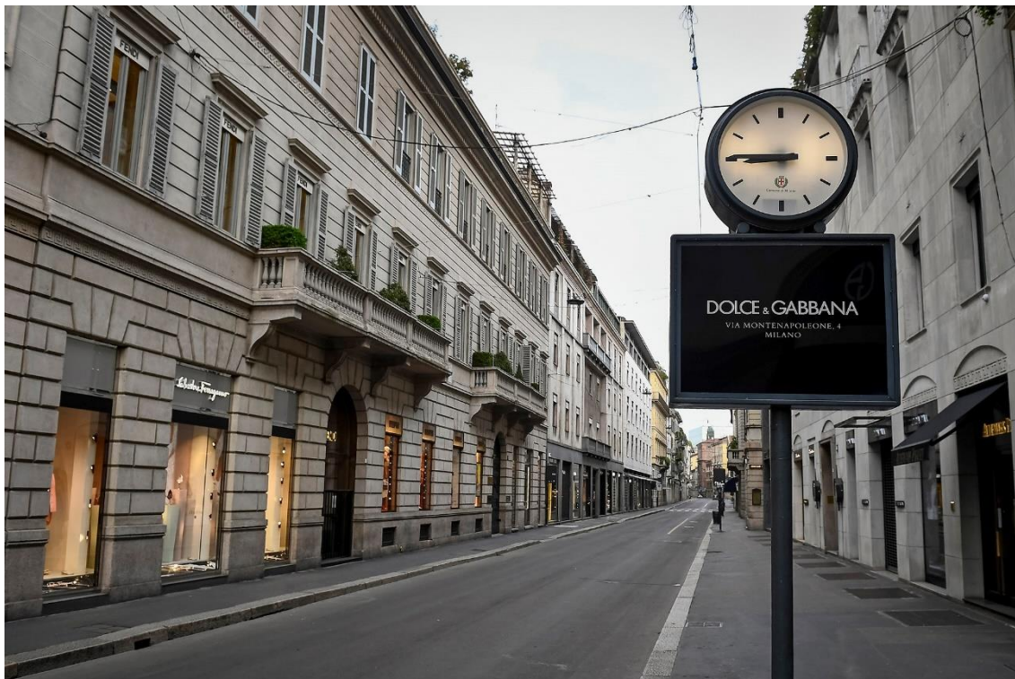
Via Monte Napoleone.

Outro negócio alimentado pela economia turística, a moda, está também a ajudar a combater a crise. O Grupo Armani começou a produzir aventais descartáveis para os profissionais de saúde nas fábricas italianas, onde costuma costurar fatos de US $ 2.500 de lã e caxemira. A Prada está a produzir máscaras protetoras. A luxuosa Moncler SpA doou 10 milhões de euros para o novo hospital de campanha em Portello.