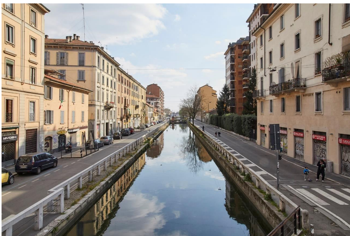
Os canais de Milão por norma estão cheios de pessoas. Agora a realidade é outra.

A última vez que a Itália ficou de joelhos, depois da Segunda Guerra Mundial, foi Milão junto com as regiões circundantes que reergueram o país. "Os italianos estavam no seu melhor durante a reconstrução, agora será igual", disse o presidente Sergio Mattarella num discurso em horário nobre.