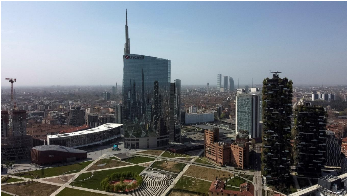
A torre UniCredit.